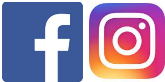
Relais média et réseaux sociaux