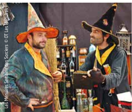
Les Menuires Semaines des Sorciers