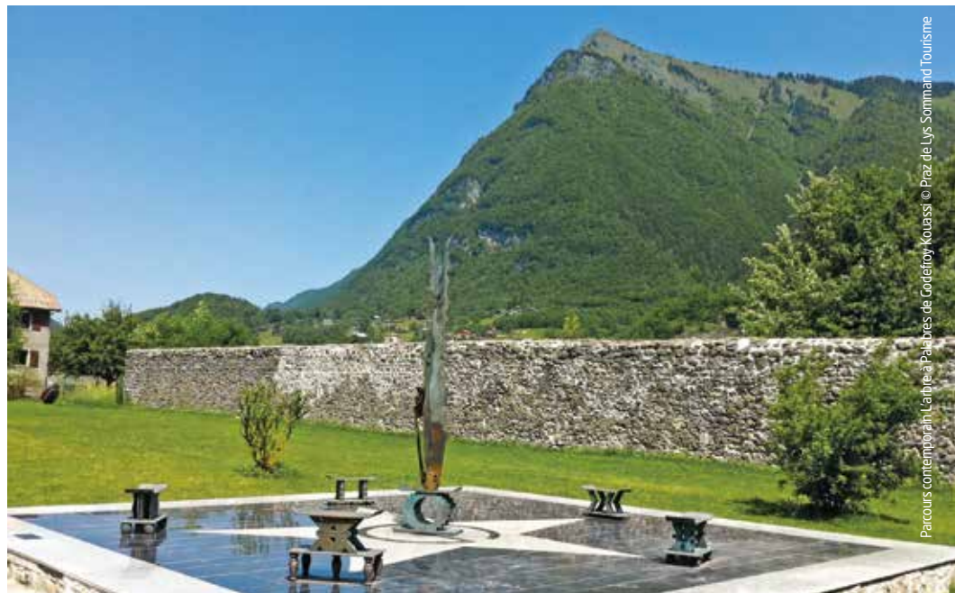
Parcours contemporain / L'air de la Patrimoine de Godefroy Mouassif