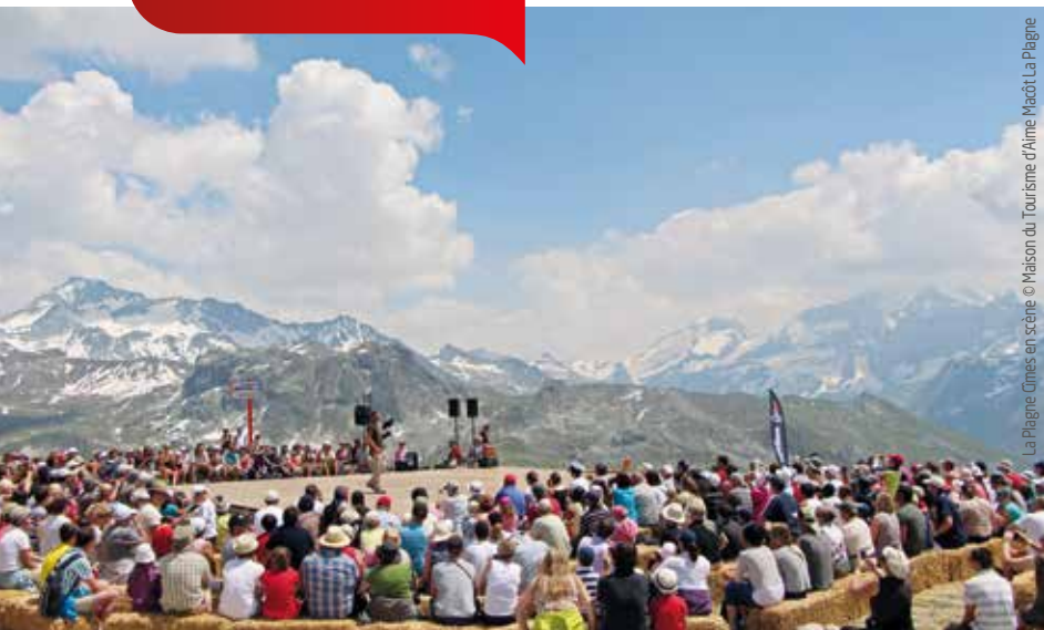
La Plagne Cimes en scène

◆ Coup de cœur pour le Festival Vacarme de Printemps du lac d'Aiguebelette, la déclinaison Jeune du Festival des Nuits d'été ! Différents parcours artistiques mis en scène et spectacles au programme (23 mars-10 avril).