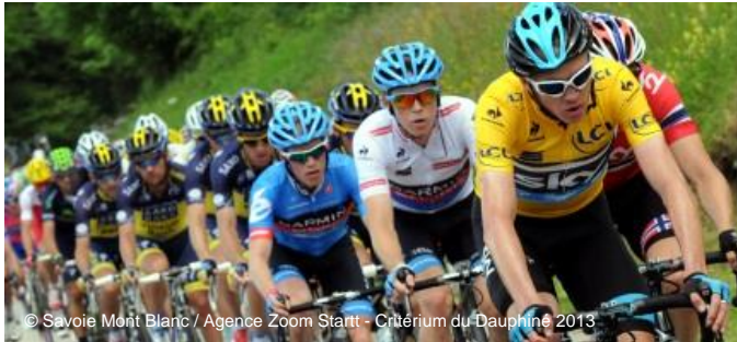
Critérium du Dauphiné 2013

113 engagés en 2016 toursavoie-montblanc.com