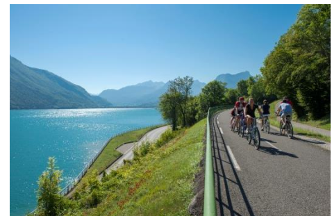
Voie verte entre Duingt et le Bout du Lac d'Annecy

5 grands cols routiers à plus de 2000 m d'altitude