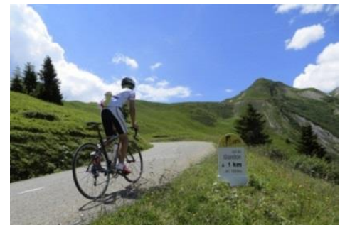
Col du Glandon