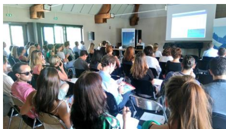
Restitution de l'étude à Annecy le 15 juin

1,35 : le nombre moyen de séjours Groupes effectués dans l'année (contre 2,3 pour les excursions)