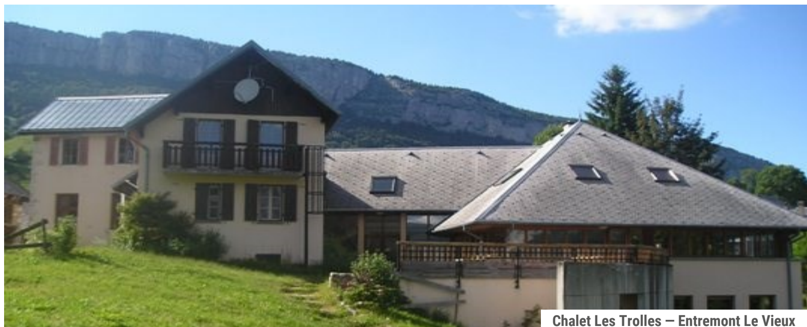
Chalet Les Trolles – Entremont Le Vieux