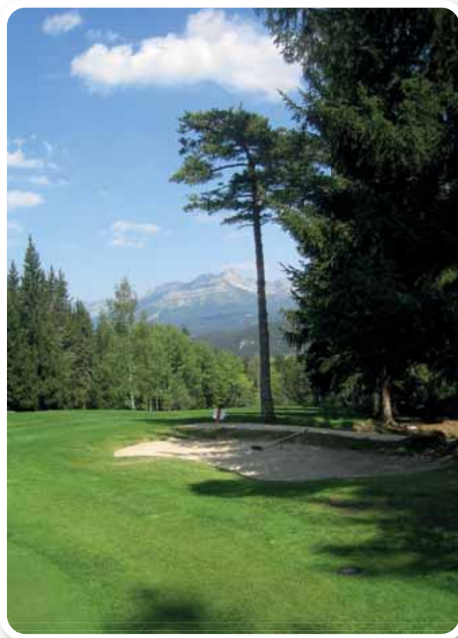
Domaine du Mont d'Arbois