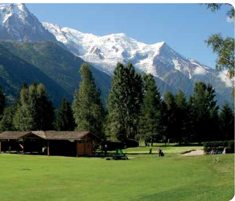
Golf de Chamonix