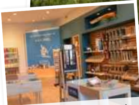
In het Musée de l'Opinel kun je de beroemde messen bewonderen en leer je over de geschiedenis van dit familiebedrijf.

nert zich nog levendig hoe Floyd Landis hier in 2006 zijn gele trui verloor. 'Hij zou hier zelfs de hele nacht whisky gezopen hebben.' Maar wat hij op het bord tovert is top. Het