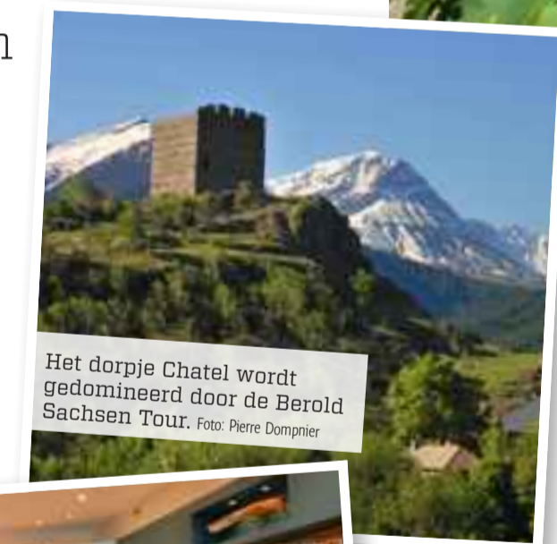
Het dorpje Chatel wordt gedomineerd door de Berold Sachsen Tour.